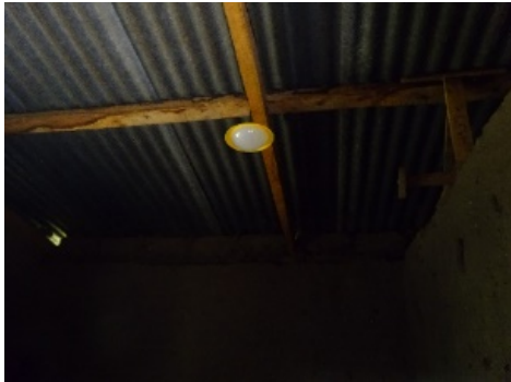
(Lamp en Batterij)

Het eerste project waar ik met mijn meester en klasgenoot aan gewerkt heb, was het bouwen van een geiten hok (we hebben de familie ook een geit gegeven om meer zelfvoorzienend te kunnen leven). Ook hebben we bij deze familie een solar licht systeem in hun huis gebouwd.